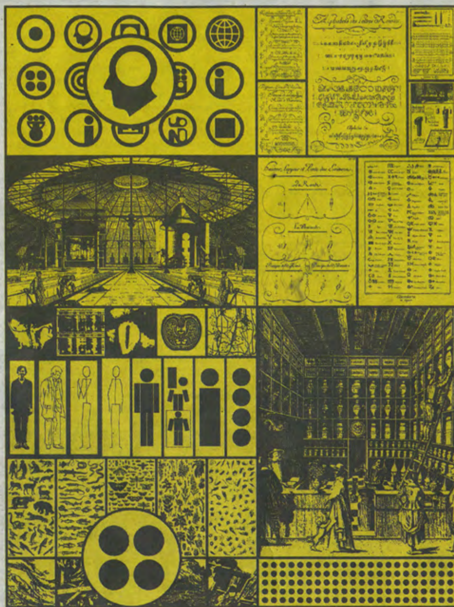
Matt Mullican, 'Two into One becomes Three', 2011

Zonder begin en einde Een van deze schitterende tekeningen is te zien op de tentoonstelling Dwaal. Labyrintische variaties in het vorig jaar geopende Centre