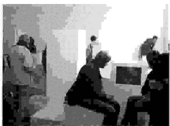
Pixels of Reality